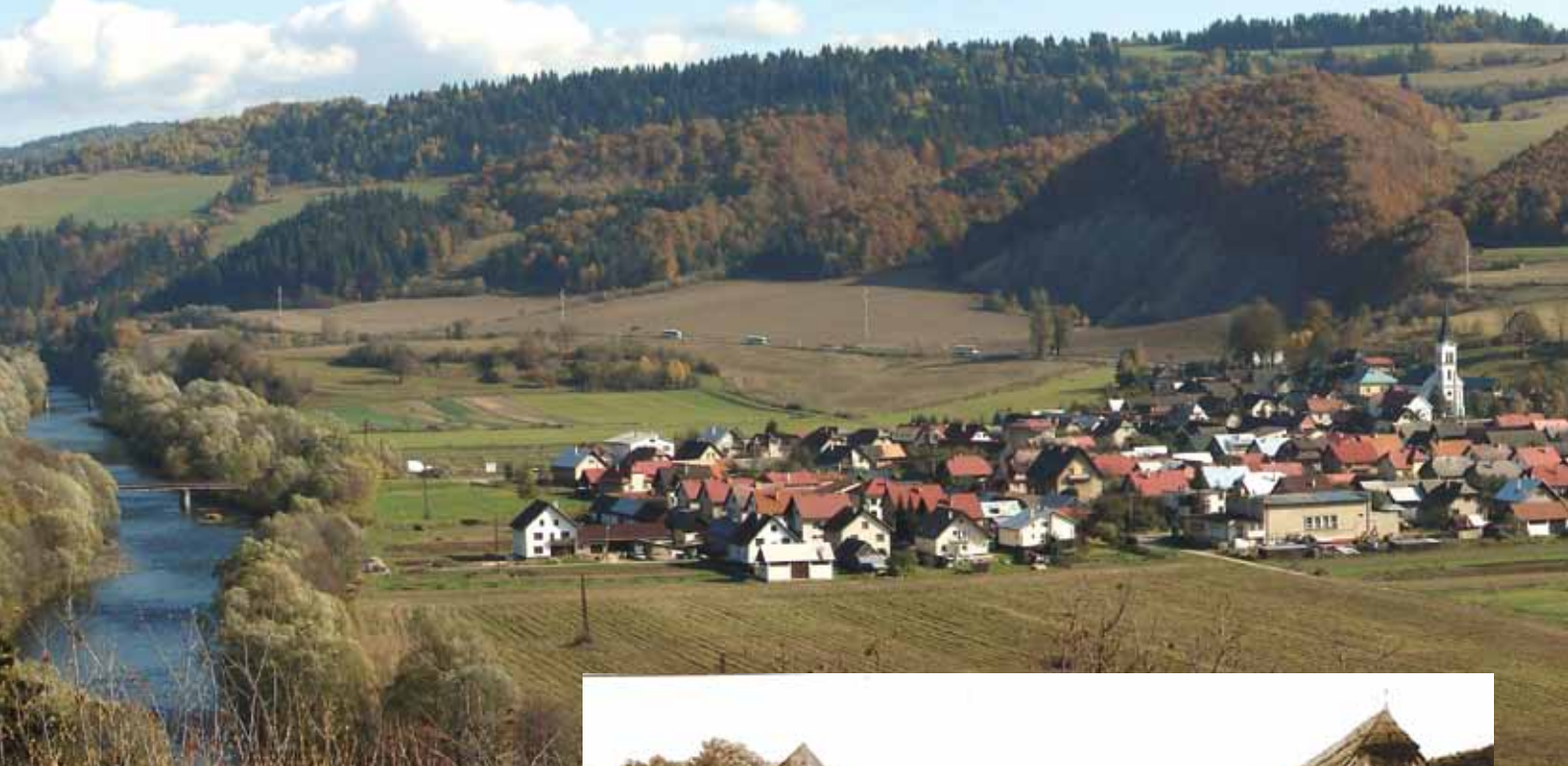
Krivá, rodiště blahoslavené Zdenky Schelingové

... zvlášť maminky prosily Pána Boha, aby někomu z jejich dětí dopřál milost povolání.