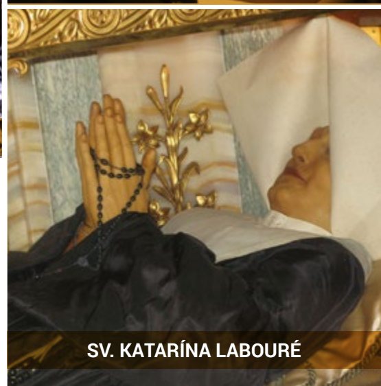
SV. KATARÍNA LABOURÉ