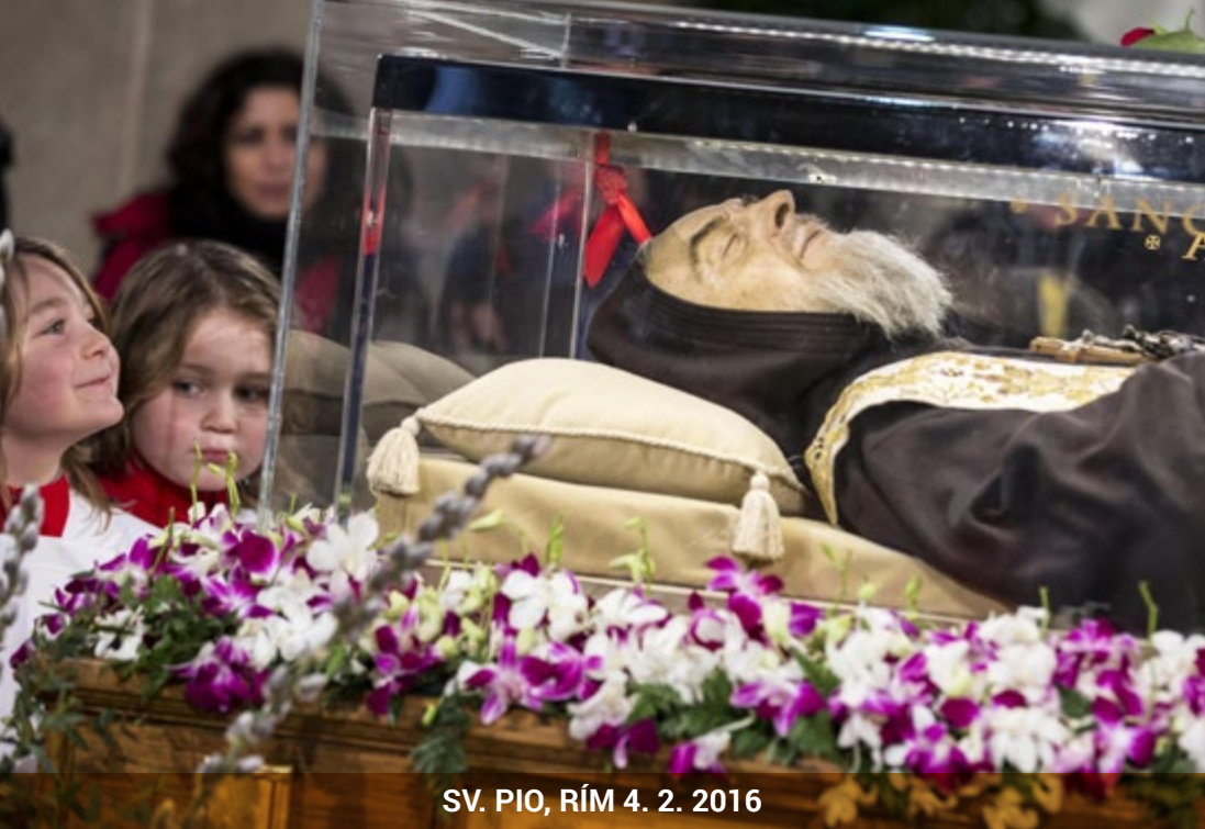
SV. PIO, RÍM 4. 2. 2016