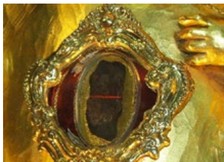
Jazyk sv. Antona

Jeho telo slávnostne previezli do Padovy, kde ho pochovali v kostolíku Santa Maria Materdomini. Celé mesto sprevádzalo svätca v pohrebnom sprievode. V rokoch 1238 - 1310, mesto postavilo veľkolepú baziliku, zasvätenú svätému Antonovi. Tam preniesli v roku 1263 jeho pozostatky. Pri tejto príležitosti, po tridsiatich rokoch otvorili rakvu, s pozostatkami svätca. Prekvapenie prítomných bolo veľké, keď uvideli, že jazyk svätého Antona ostal neporušený. Svätý Bonaventúra vtedy pobozkal jazyk a povedal: „Ó, požehnaný jazyk, ktorý vždy zveleboval Pána a dal ho zvelebovať aj iným, hľa, zjavilo sa, aké veľké zásluhy mal u Boha.“ Jazyk, čeľusť a hlasivky uložili do relikviárov. Posledný výskum pozostatkov sv. Antona sa konal v roku 1981. Je vedecky nevysvetliteľné, že taká anatomická časť tela, ako je jazyk, sa po viac ako 770 rokoch ešte nerozpadla. Tento jazyk, vystavený v relikviári, obdivujú tisíce pútnikov z celého sveta, ako zázračné znamenie evanjelizačného „nástroja“ svätého Antona.