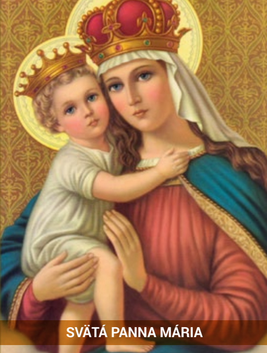
SVĚTÁ PANNA MÁRIA