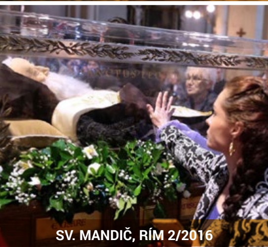
SV. MANDIČ, RÍM 2/2016