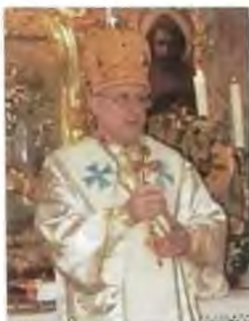
Mons. Ladislav Hučka, gr. k. biskup v Prahe