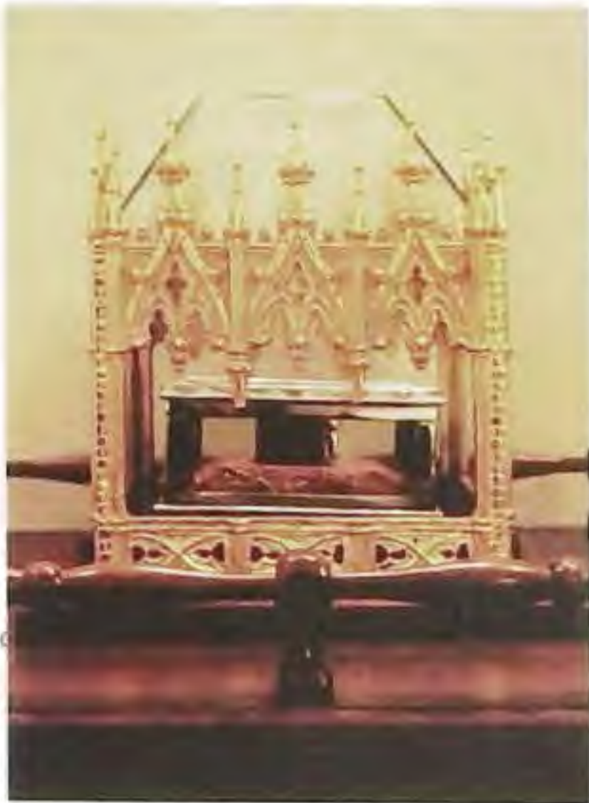
Relikviár sv. Cyrila v katedrále v Nitre