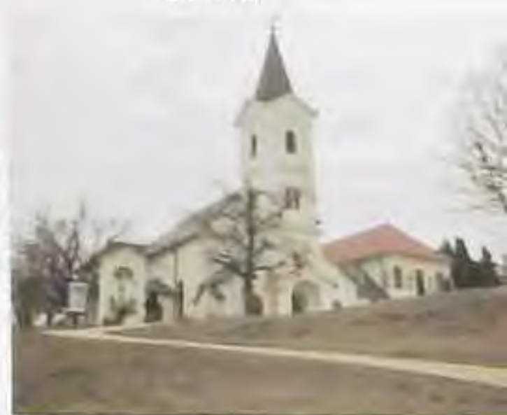
Nitra - Kalvária