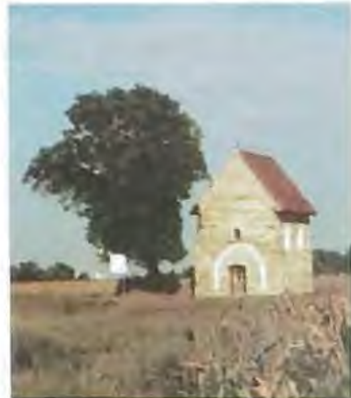
Kostol v Kopčanoch datovaný