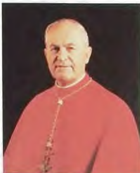
Jozef kardinál Tomko