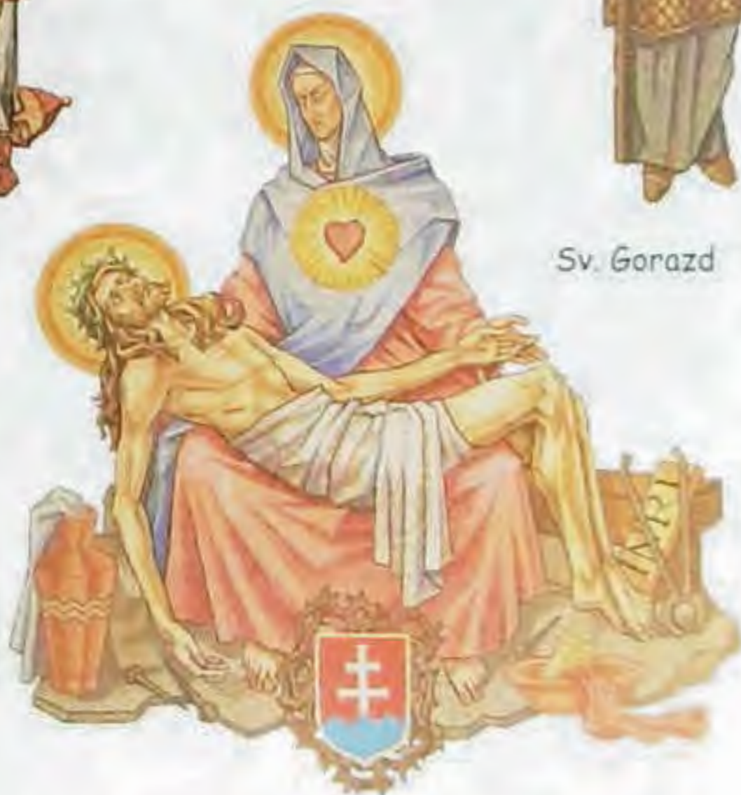
Sedembolestná Panna Mária, patrónka Slovenska