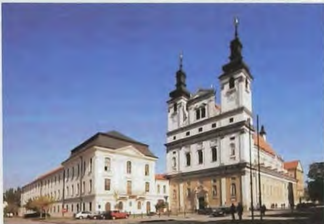
Univerzitný kostol v Trnave (teraz katedrála)