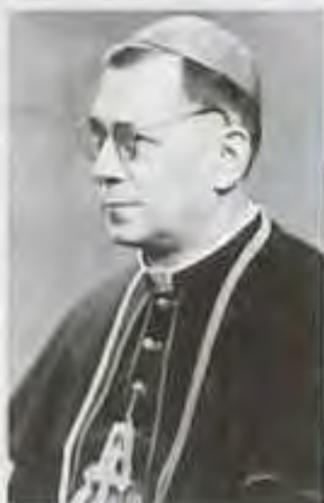
Mons. Ambróz Lazík, ap. ad. trnavský