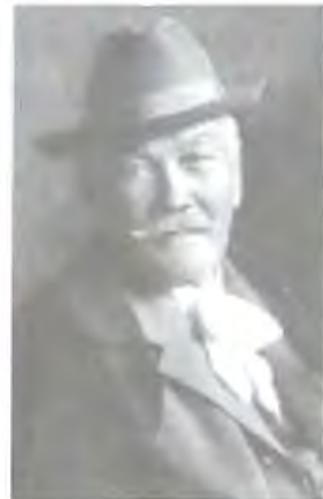
Pavol Országh Hviezdoslav