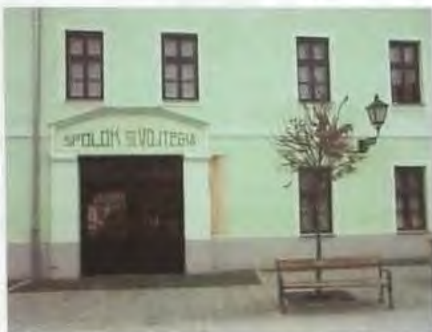
Budova Spolku sv. Vojtecha v Trnave