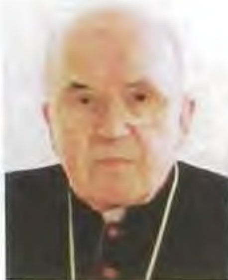
Mons. Štefan Vrablec em. trnavský pom. biskup