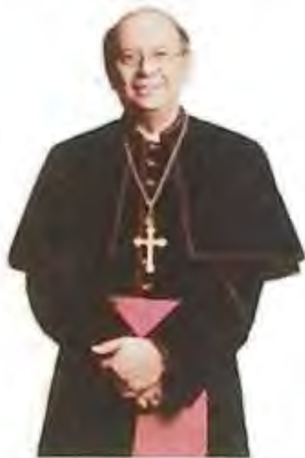
Mons. Ján Orosch, trnavský arcibiskup