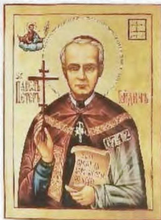
Bl. Peter Pavol Gojdič, mučeník