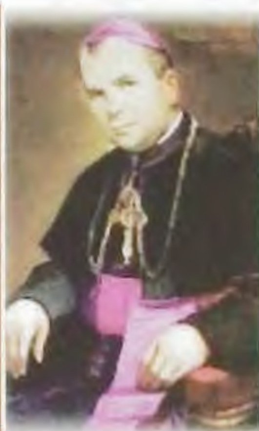
Bl. Vasil' Hopko, mučeník