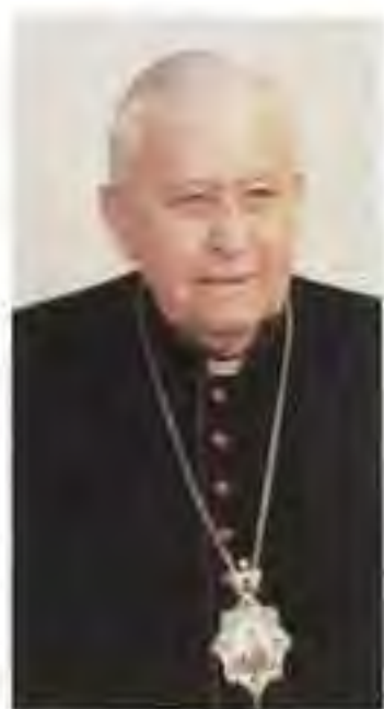
Mons. Eugen Kočiš, em. gr. k. pomocný biskup v Prahe