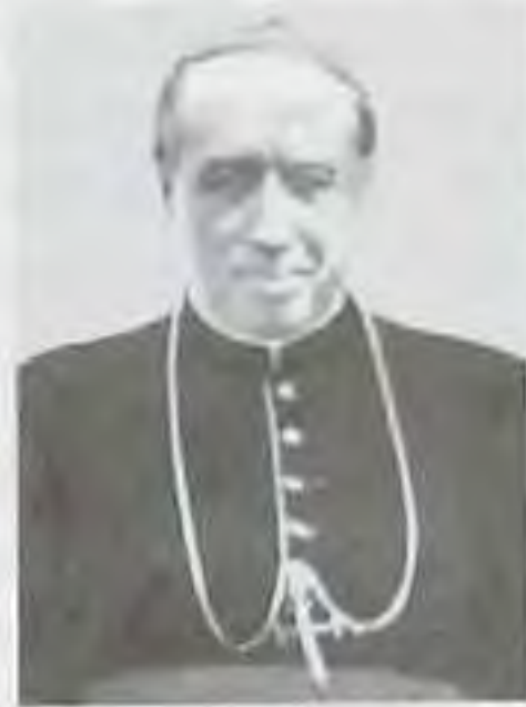
Mons. Štefan Barnáš, spiš. pomocný biskup