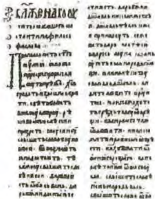
Rukopis Proglas v cyrilike