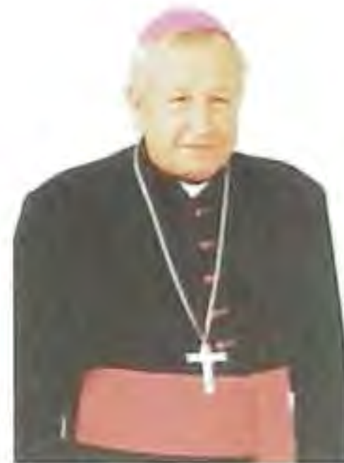
Mons. Štefan Sečka, spišský biskup