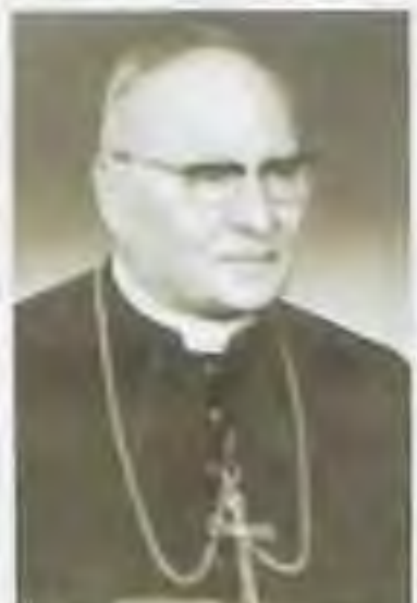
Mons. Július Gábris, ap. ad. trnavský (titul. arcibiskup)