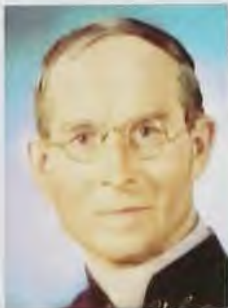
Mons. Ján Vojtaššák, spišský biskup, ctihodný Boží služobník*