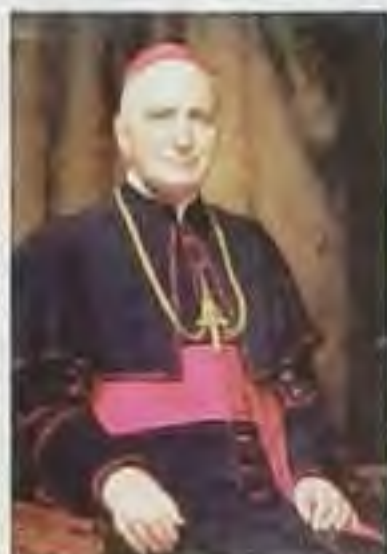
Mons. Róbert Pobožný, rožňavský biskup