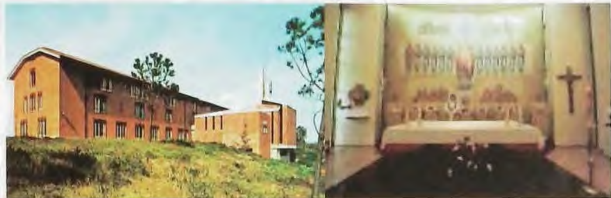
Pohľad na SÚSCM v Ríme