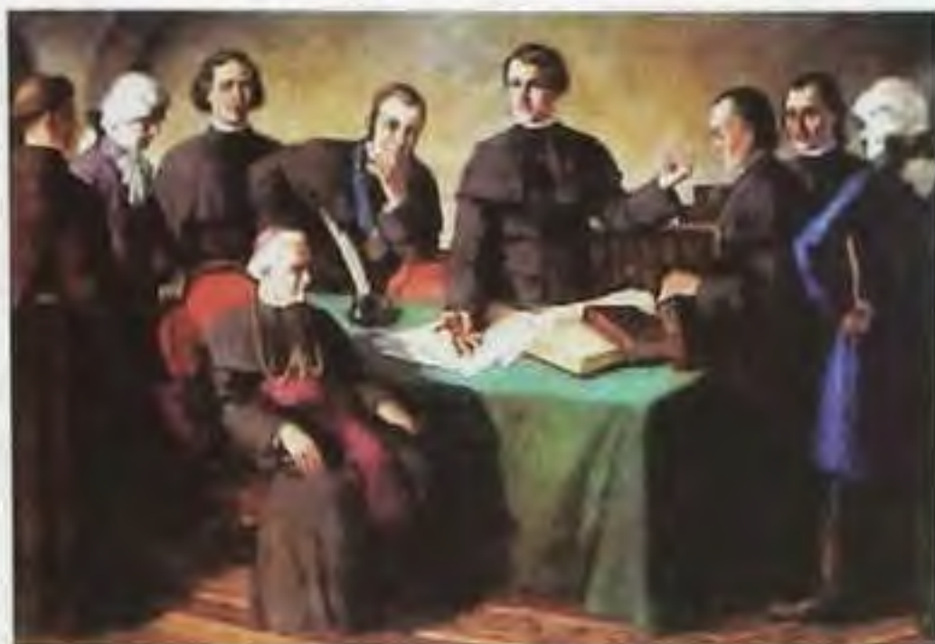
Slovenské učené tovarišstvo v Trnave