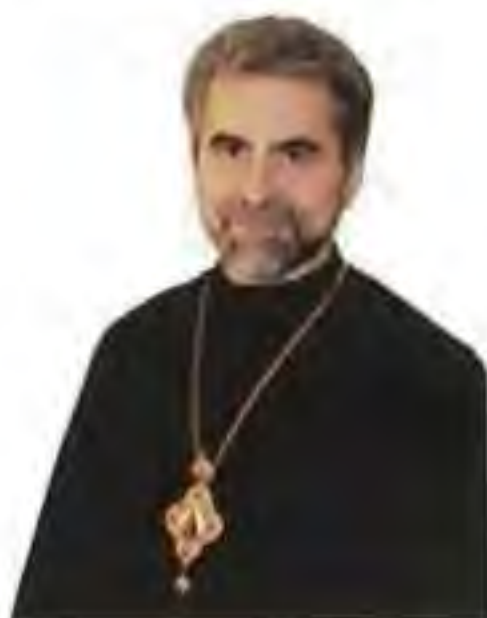
Mons. Milan Chatur, košický gr. k. biskup