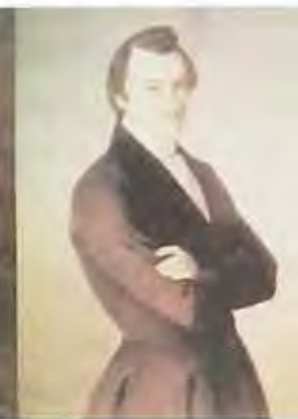
Michal Miloslav Hodža