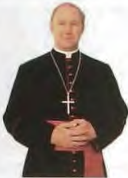
Mons. Róbert Bezák em. trnavský arcibiskup