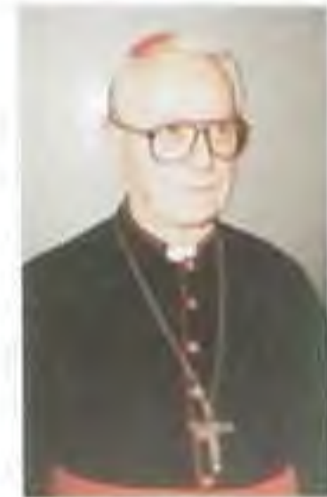
Mons. Ján-Christam kardinal Korec em. nitriansky biskup 1924 - 2015