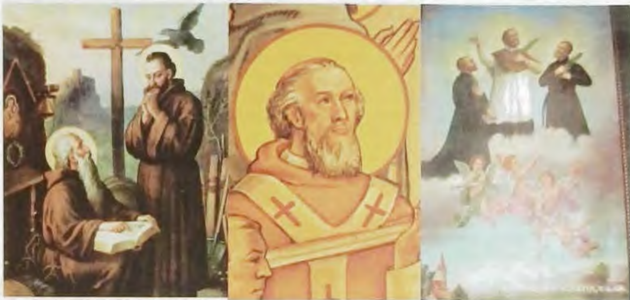
Sv. Andrej-Svorad a Benedikt, mučeník