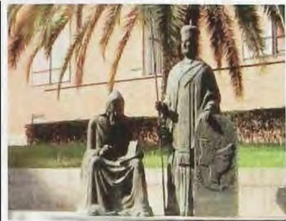
Súsošie sv. Cyrila a Metoda pred ústavom