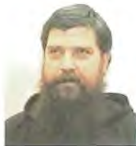
Mons. Dávid Tencer, OFM Cap biskup Reykjavíku (Island)