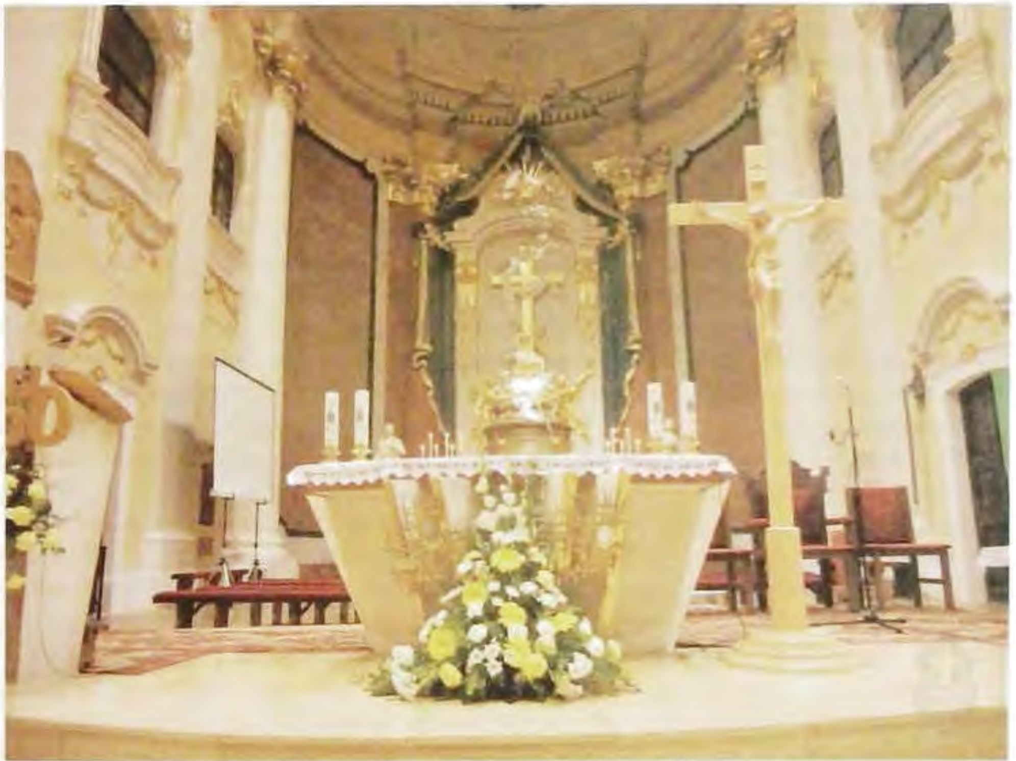
Bazilika Sedembolestnej Panny Márie - Národná svätyňa v Šaštíne