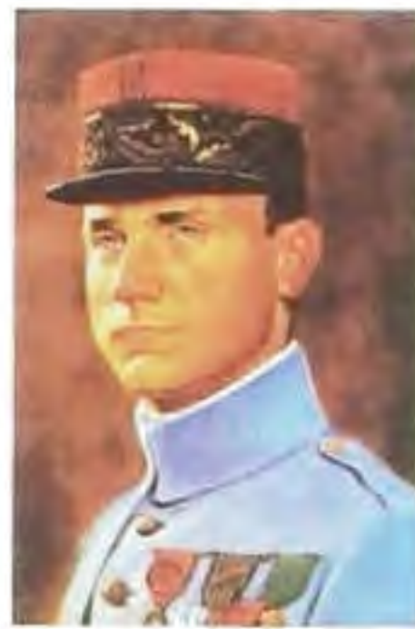
Milan Rastislav Štefánik