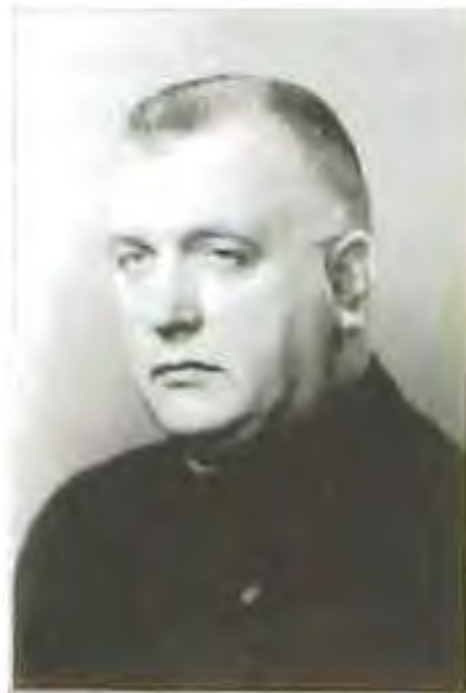
Jozef Tiso prvý prezident Slovenskej republiky