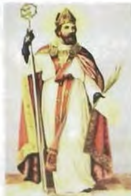
Sv. Vojtech, patrón SSV.