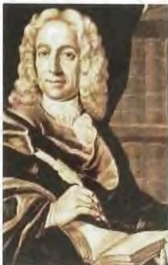
Matej Bel, polyhistor