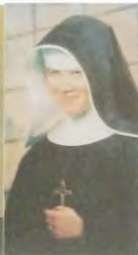
Bl. Zdenka Schelingová, mučenička