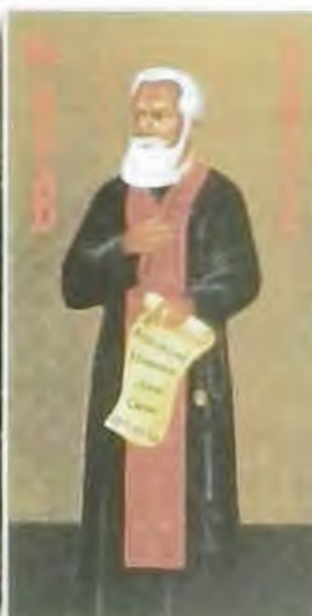
Bl. Metod Dominik Trčka, mučeník