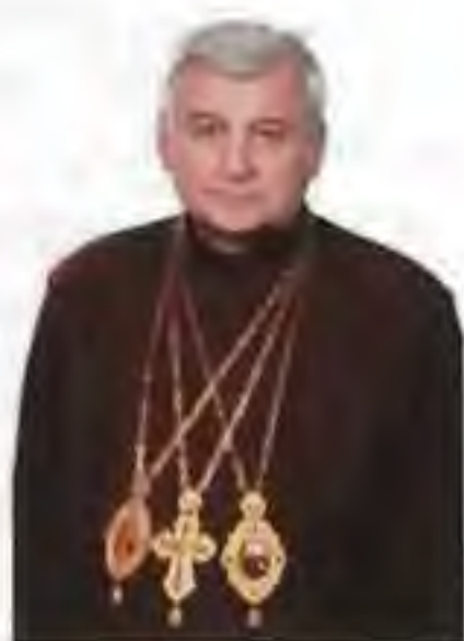
Mons. Ján Babjak, prešovský gr. k. arcibiskup, metropolita