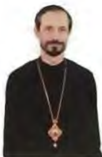
Mons. Milan Lach, prešovský gr. k. pomocný biskup