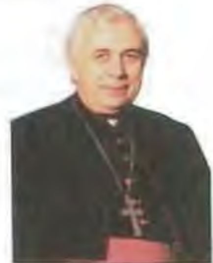
Mons. Andrej Imrich em. spišský pomocný biskup