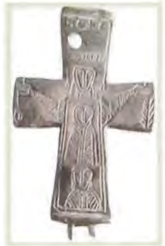
Kaptorga z Veľkej Mače z 9.-10. st.