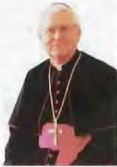
Mons. Ján Sokol em. trnavský arcibiskup