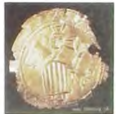
Pozlátené plakety z prenosného oltára z Bojnej z 9. st.