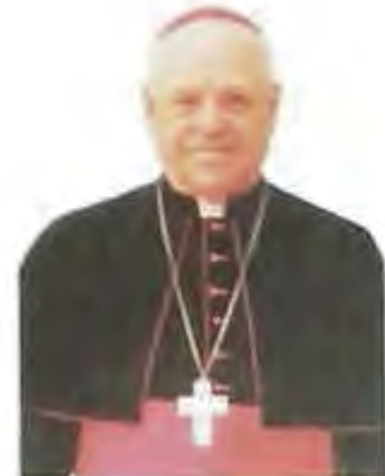
Mons. Jozef Zlatňanský em. biskup (Rím)