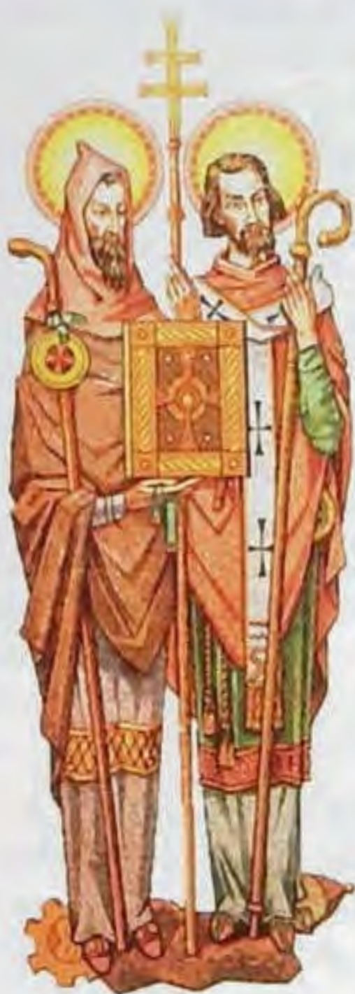
Sv. Cyril a Metod