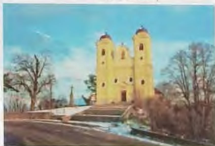
Skalka pri Trenčine