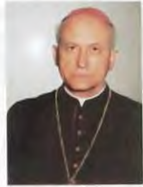
Mons. Alojz Tkáč em. košický arcibiskup