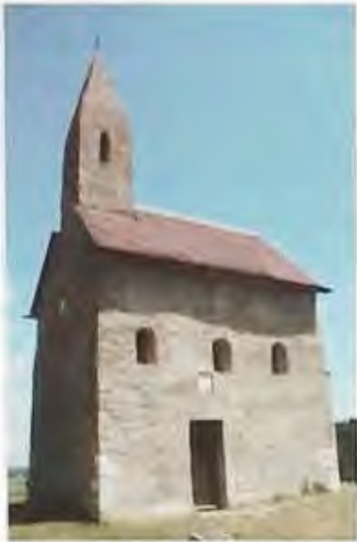
Kostol v Dražovciach z 13. st.