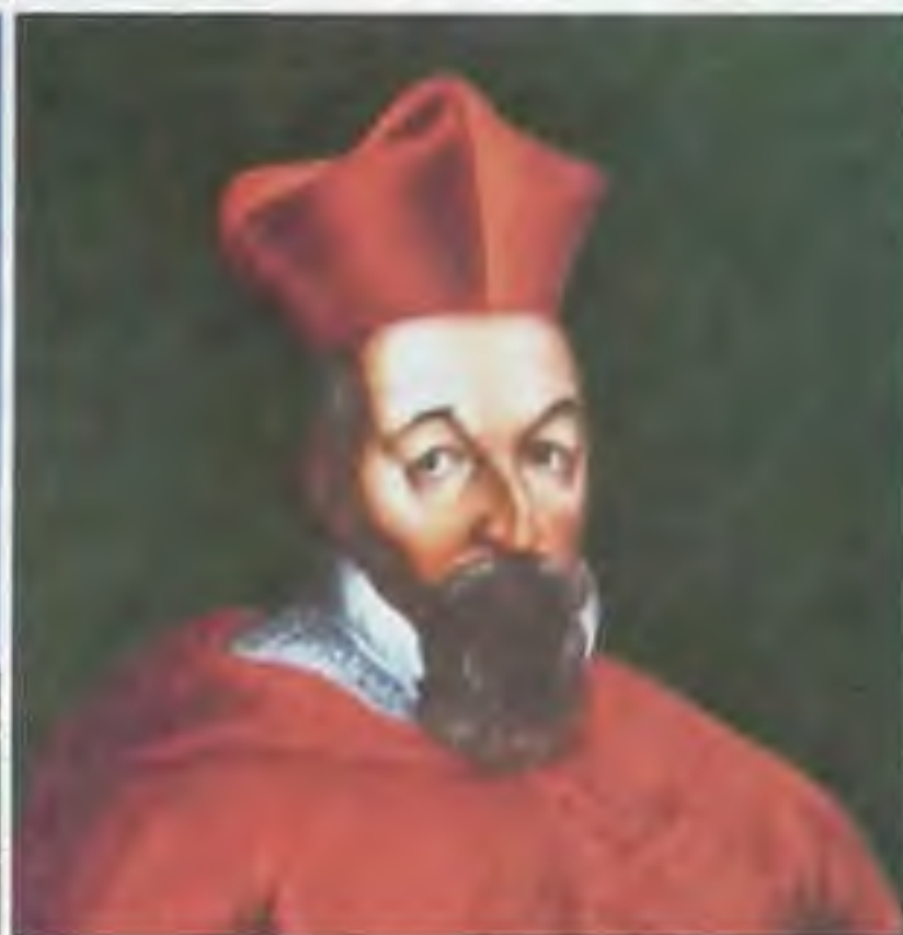
Kardinál Peter Pázmány