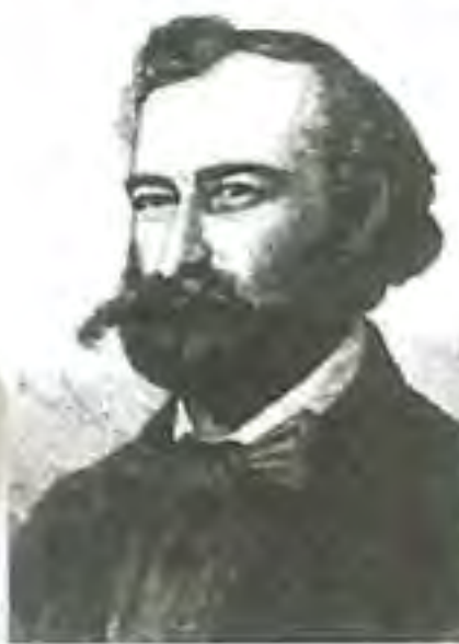
Ján Botto Jozef