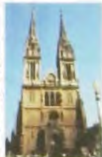
Konkatedrála Poprad Konkatedrála Prešov